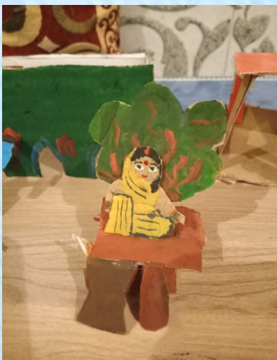
पेड़ के नीचे औरत