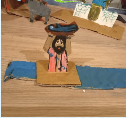
यमुना पार करते वासुदेव जी