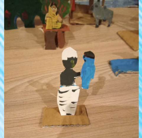
तृणावर्त राक्षस और कृष्णा