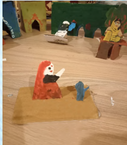
कृष्णा के पीछे यशोदा