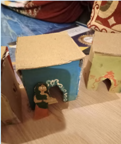
सूप पछोरती औरत