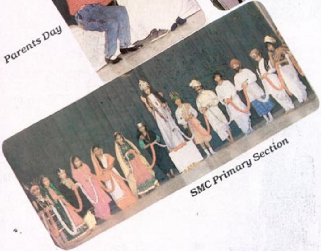
SMC Primary Section