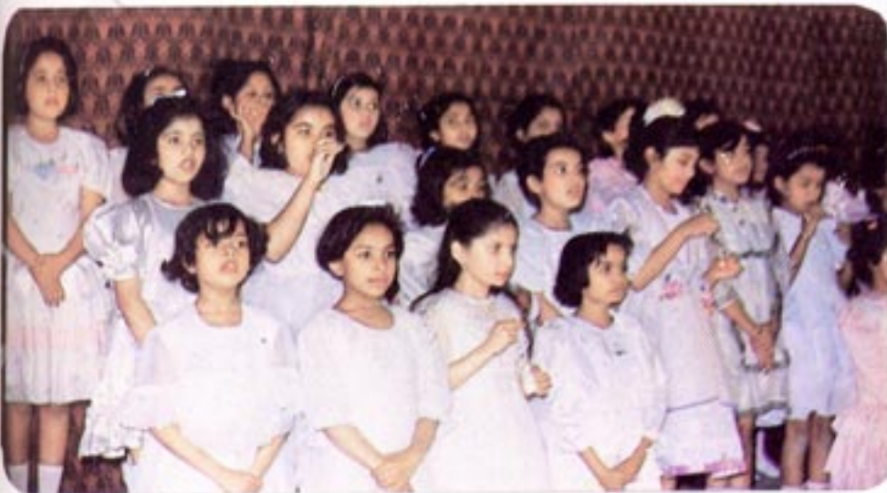
We entertain our Parents SMC Primary Section