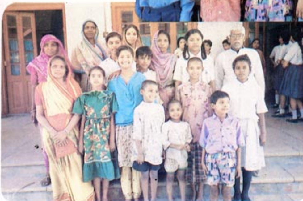
Children Whose education is sponsored by L.T. Sers