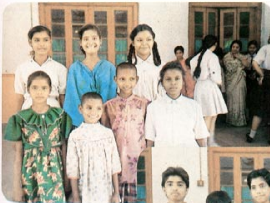
Sharing Joy Multiplies