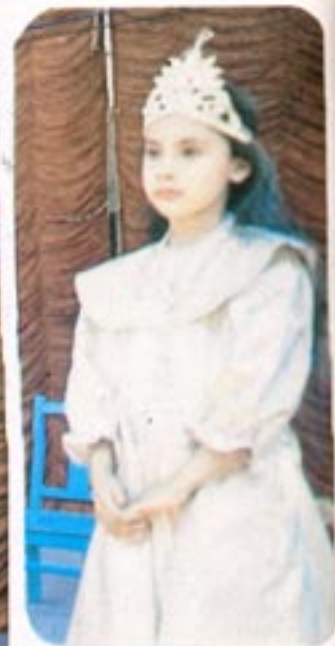
The Tiny Tots of S. M. C. (21)