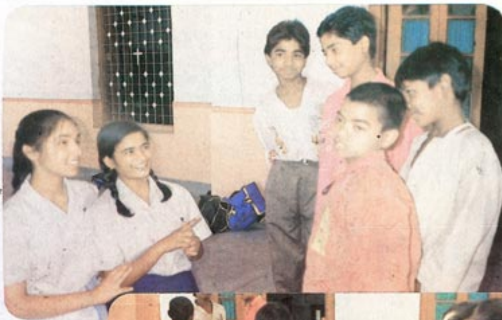
The Less Privileged