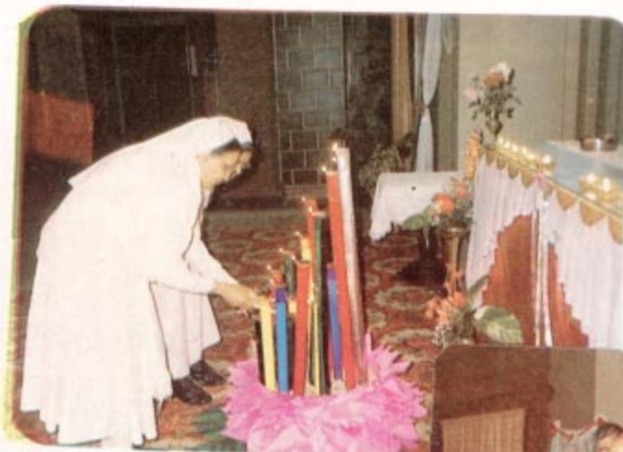
Opening of the Jubilee Year.....