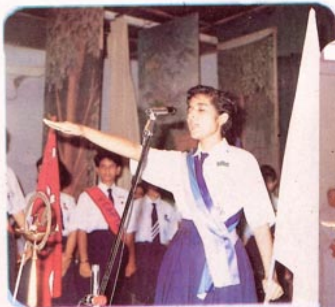
LEADERS PLEDGE TO SERVE.....