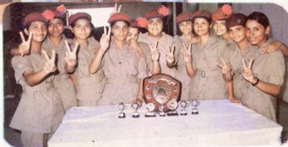
A JUBILAN NCC CADETS WHO BAGGED THE BEST TEAM PRIZE & OTHER PRIZES AT THE NCC CAMP.