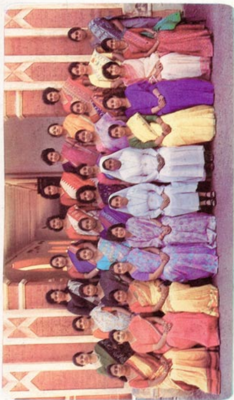
Primary Section Staff 1994-1995