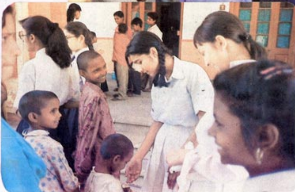
L.T. Serv on a Mission