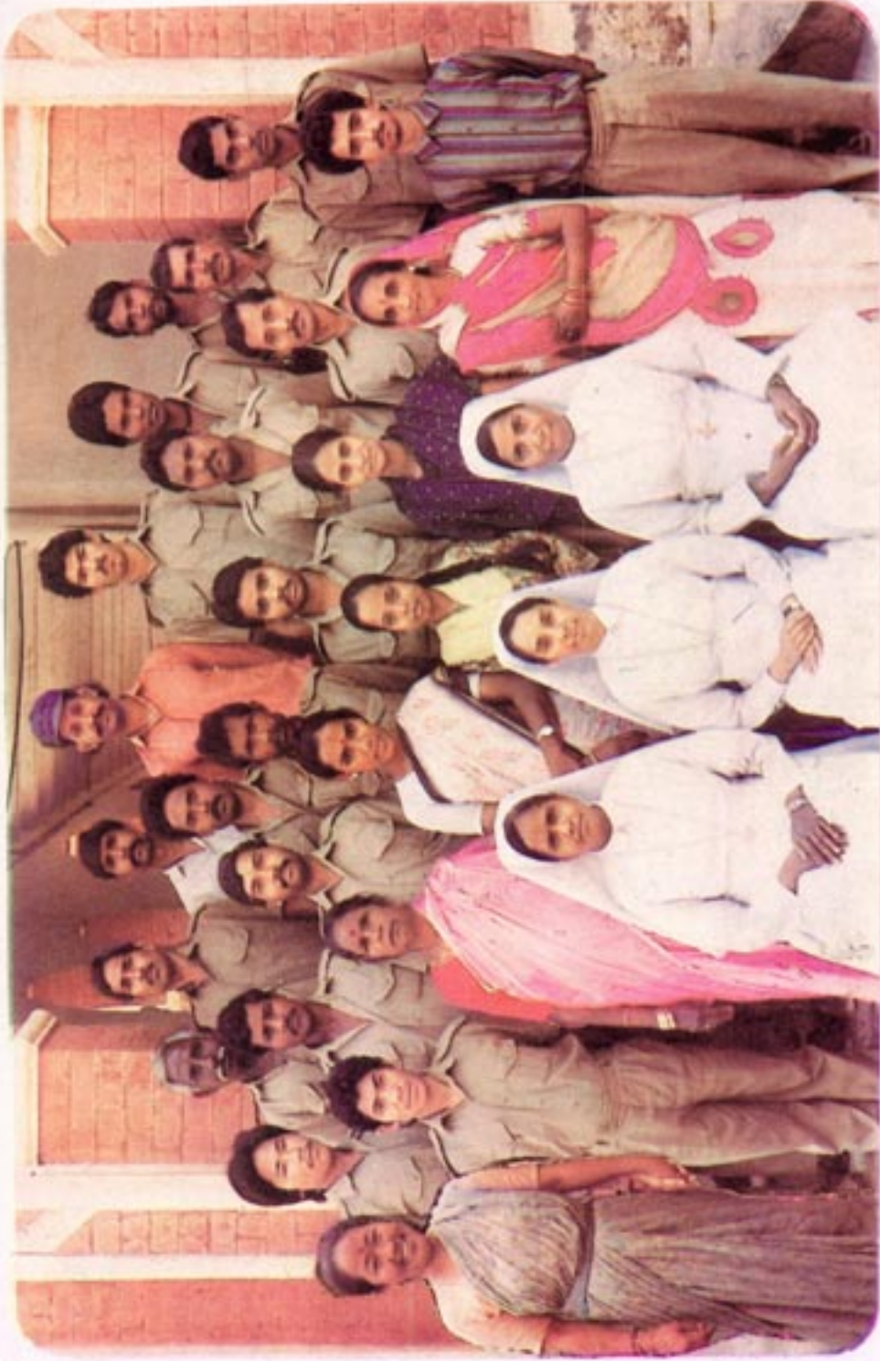
Our Co-Workers 1994-95