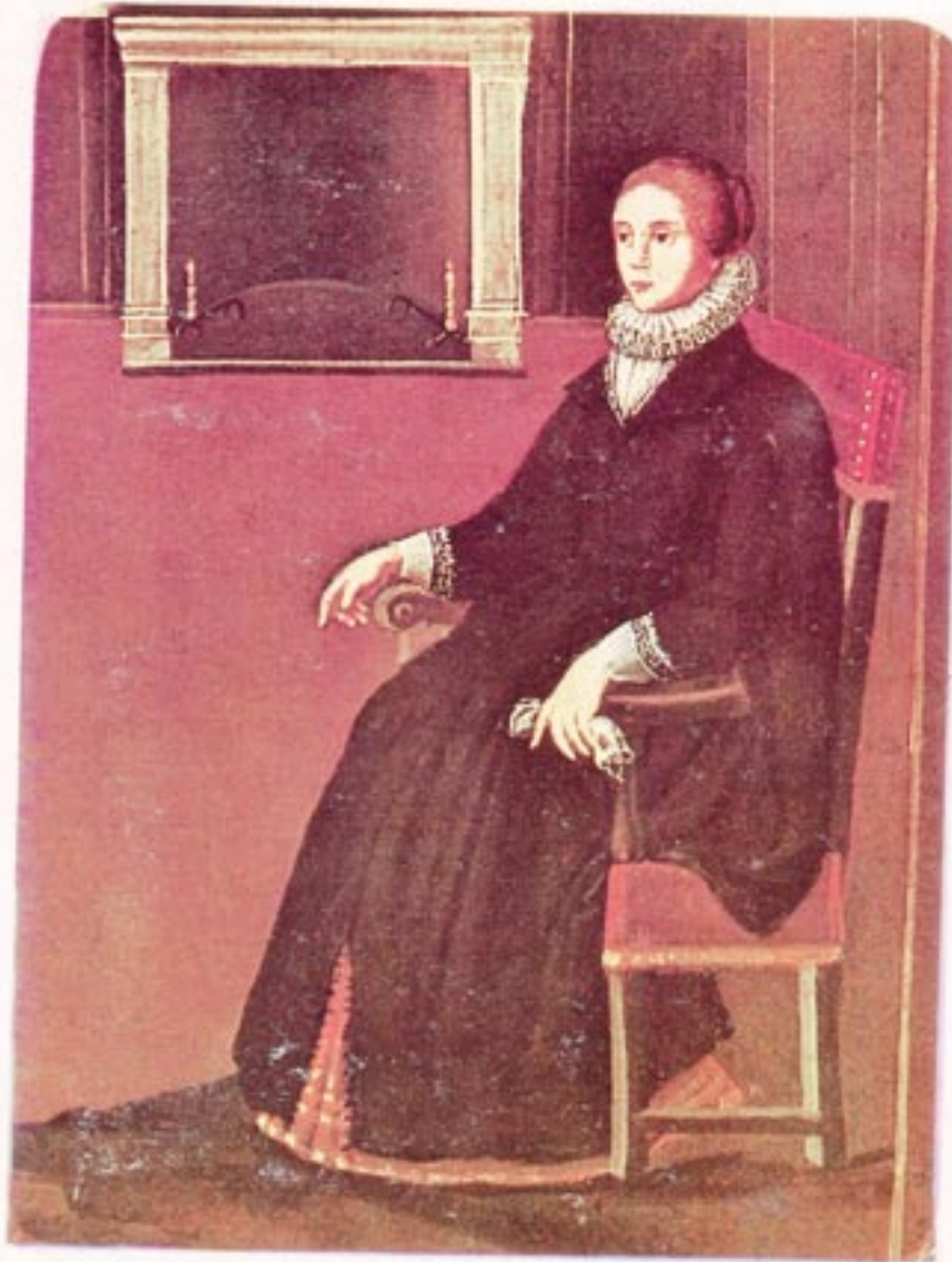
MARY WARD 1645-1995

"To Love the poor Persevere in the Same Live, die and rise with them Was all the aim of Mary Ward Who having Lived 60 years and 8 days, Died 20th Jan. 1645." (Inscription on the tombstone)