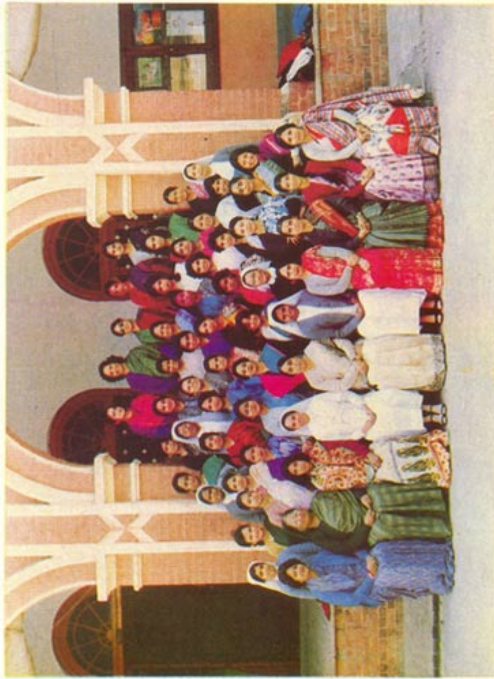
S M C Staff 1993-94