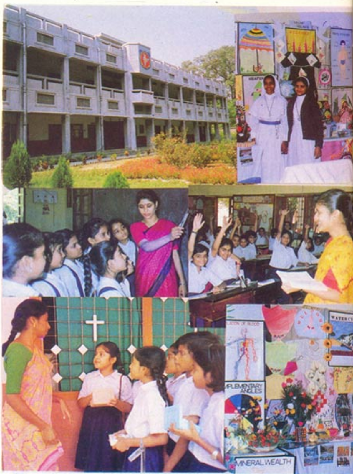
Our Trainees in Action