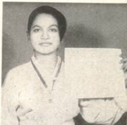
GOLD MEDALIST IN KARATE